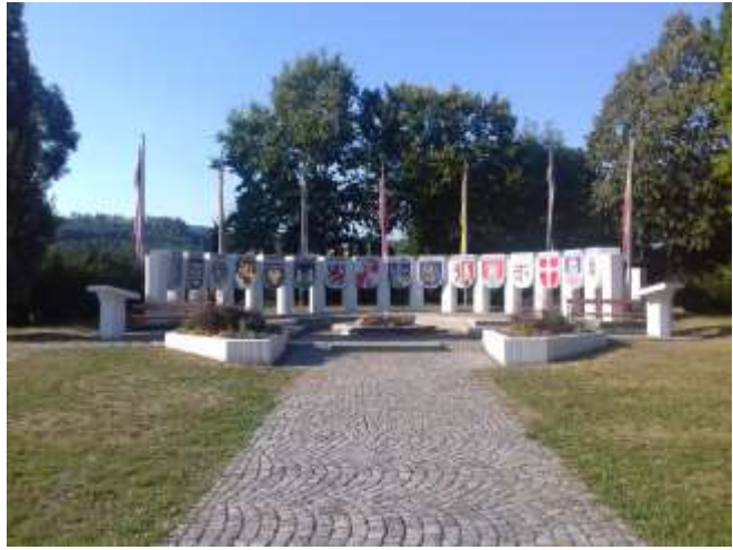
Pöchlarn, a Niebelung emlékmű.

Melk: Az osztrák barokk legnagyobb hatású egyházi épülete